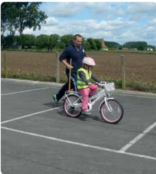
Kijk! Ik fiets!