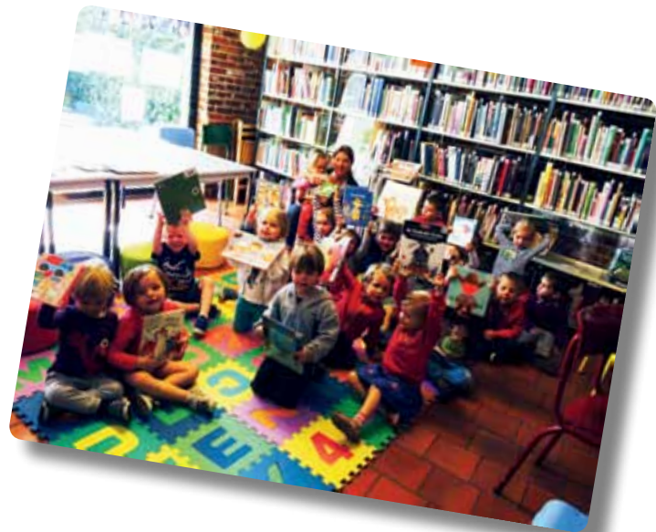
Jeugdboekenweek voor kleuters in de bib