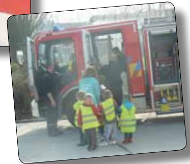
Jeugdkamp Brandweerman Sam