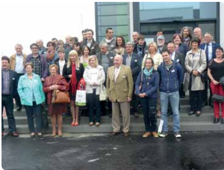
Verwelkoming van onze nieuwe inwoners en Vrijetijdsbeurs "Galmusant"